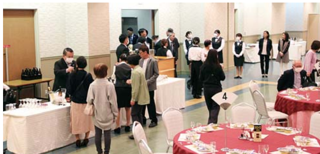
参加者はウェルカムドリンクで

10月11日(金)十和田市のサン・ロイヤルとわだにおいて、今年も170人余りが参加して『ぎ・縁会』が開催されました。