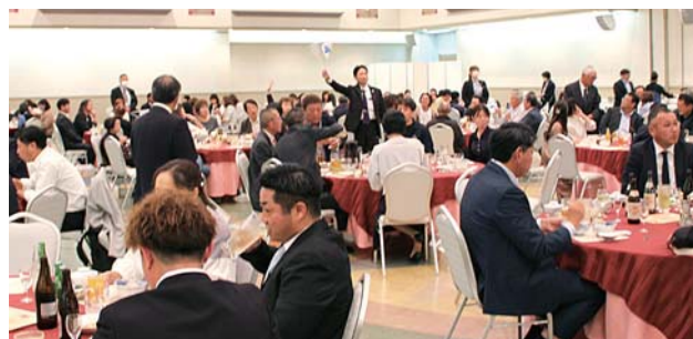
このテーブルの方 当たっています!!

来年も多数の豪華景品を準備しての開催を予定しておりますので、皆さまの多数のご参加をお待ちしております。